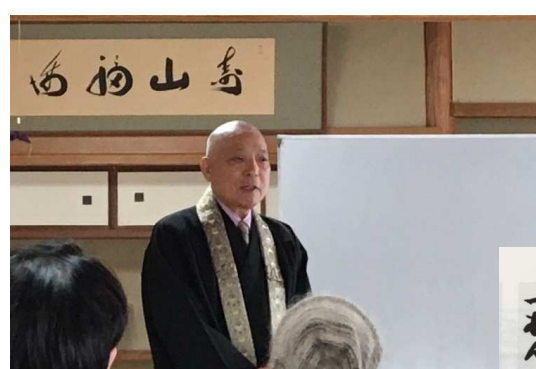
《高齢者教養講座》第3日曜日 14時 毎月、当法人代表理事をはじめ、 各専門分野より講師をお招きして 開催しています♪